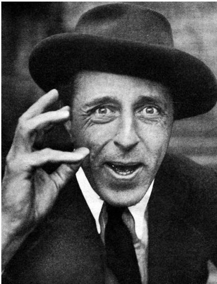
David W. Griffith

Prezentarea câtorva filme din perioada de început a carierei marelui regizor american David W. Griffith , cel pe care Chaplin îl numea „profesorul nostru, al tuturor”.