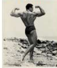
Erotica and nudes