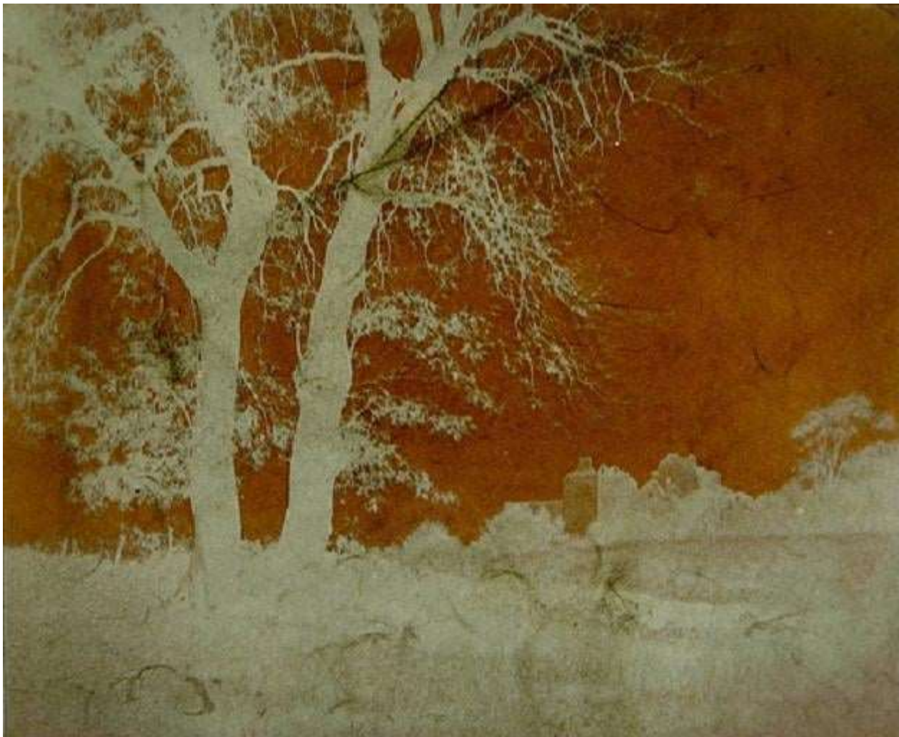
William Henry Fox Talbot: Doune Castle, Scotland, 1844. Calotype negative

Tuesday, 23 October 2018, 10.00 a.m. Library of the Romanian Academy, "Ion Heliade Rădulescu" Amphitheatre 125, Calea Victoriei, Bucharest